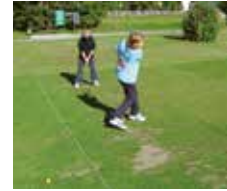
Golfplatz direkt in der Nähe des Hotels