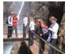
Abenteuertour am Wasserfall