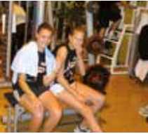
Anmut und Power im Krafraum