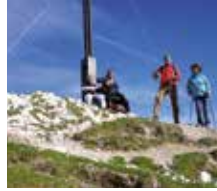
Auf dem Gipfel