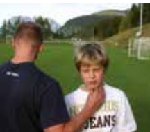
Pulsmessung nach der Belastung