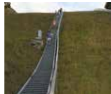
Treppenbergläufe auf der Skischanze