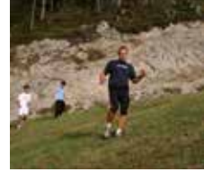
Bergläufe an der Olympiaschanze