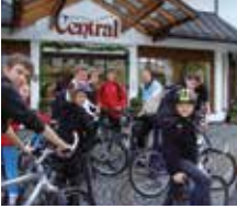
Start zur Mountain-Bike-Tour