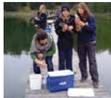
Angeltour am See