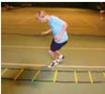
Koordination im Zirkeltraining