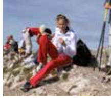
Verdiente Pause beim Bergwandern