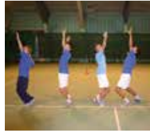
Techniktraining in der Tennishalle