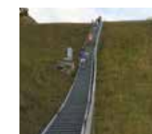
Treppenbergläufe auf der Skischanze