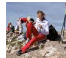
Verdiente Pause beim Bergwandern