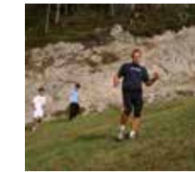
Bergläufe an der Olympiaschanze