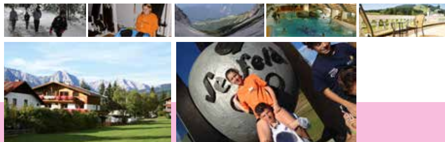
Die Olympiaregion Seefeld ist Euer Gastgeber