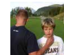
Pulsmessung nach der Belastung