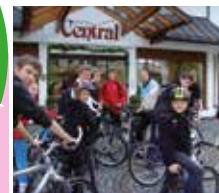
Start zur Mountain-Bike-Tour