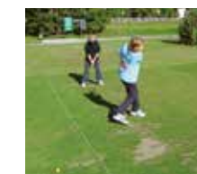
Golfplatz direkt in der Nähe des Hotels