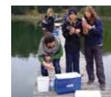
Angeltour am See