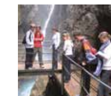
Abenteuertour am Wasserfall