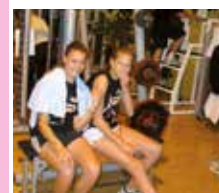
Anmut und Power im Krafraum