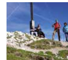
Auf dem Gipfel