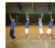
Techniktraining in der Tennishalle